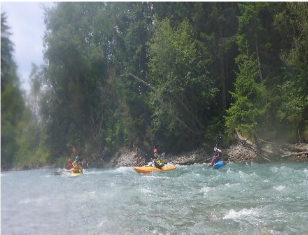
Gemeinschaftsfahrt auf dem Lech