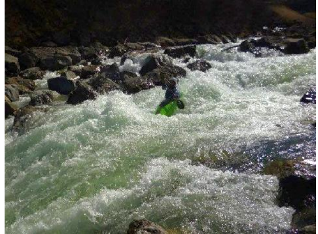
Gemeinschaftsfahrt auf der Iller

Für die Teilnahme an unseren Ausfahrten und/oder Trainingsangeboten gelten unsere Teilnahmebedingungen, welche auf der Homepage heruntergeladen werden können.